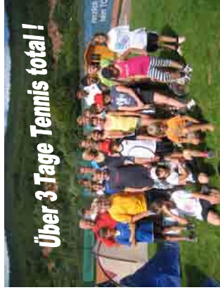
Über 3 Tage Tennis total!